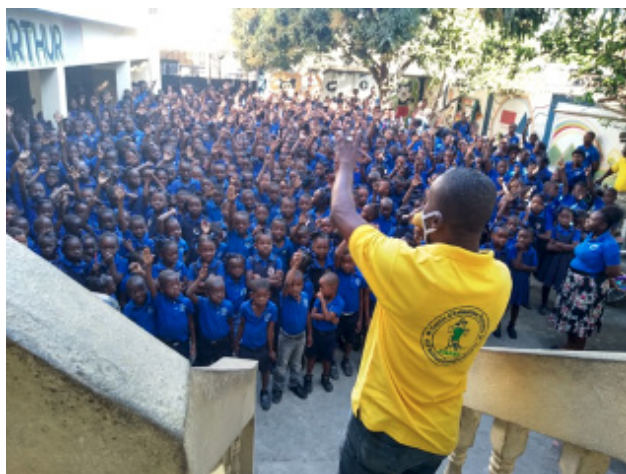
Sensibilisation sur les violences faites aux femmes et aux filles par l'organisation Centre d'Animation Paysanne et d'Action Communautaire (CAPAC), dans le département du Nord-Est.