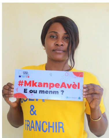
Campagne de sensibilisation M kanpe Avèl , en partenariat avec l'organisation Perspectives pour la Santé et le Développement (PESADEV).