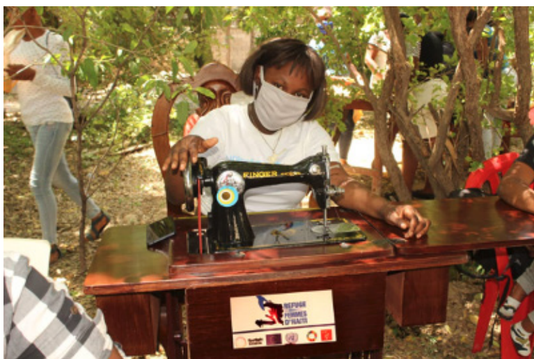
Formation en couture offerte à des travailleuses du sexe dans la ville de Croix-des-Bouquets.