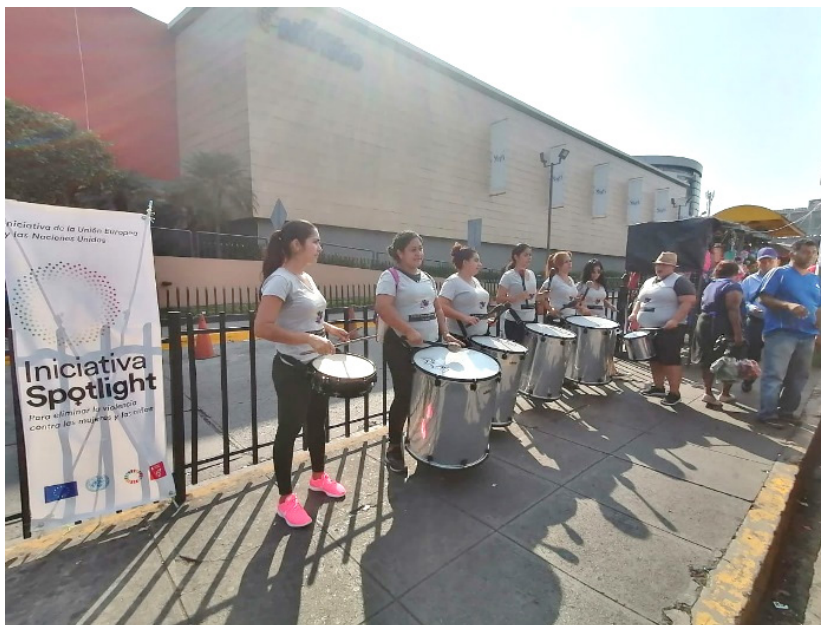
Fotografía: Las Dignas.

Iniciativa Spotlight El Salvador promueve la participación política de las mujeres a través del apoyo al Grupo Parlamentario de mujeres.