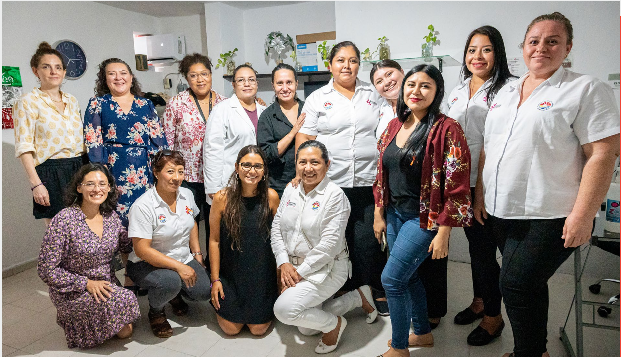
Visita del equipo del Programa Regional al Punto Morado , Módulo de Atención a la VBG, Cancún, México, 2022