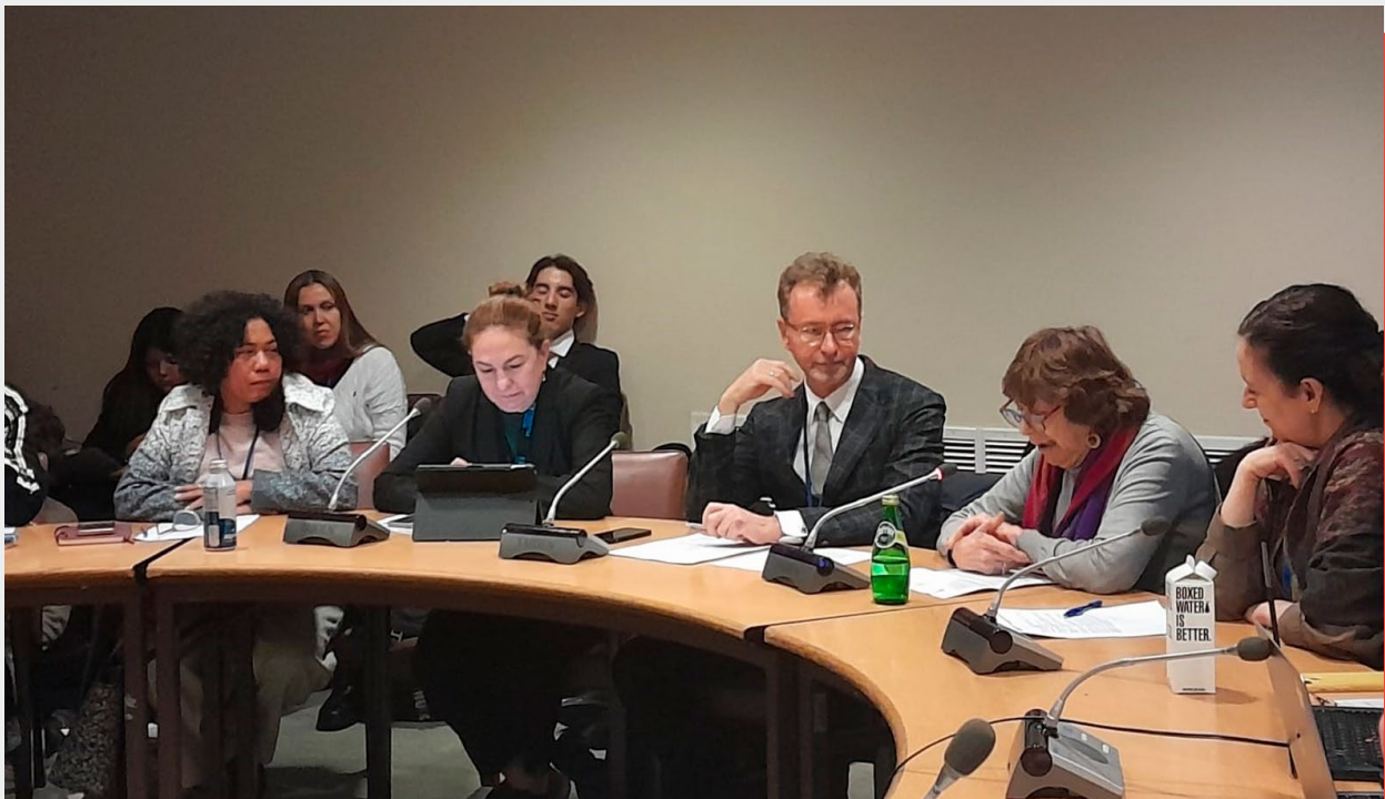
El aporte innovador de la Iniciativa Spotlight en América Latina para eliminar la violencia contra mujeres y niñas, CSW67, Nueva York, 2023