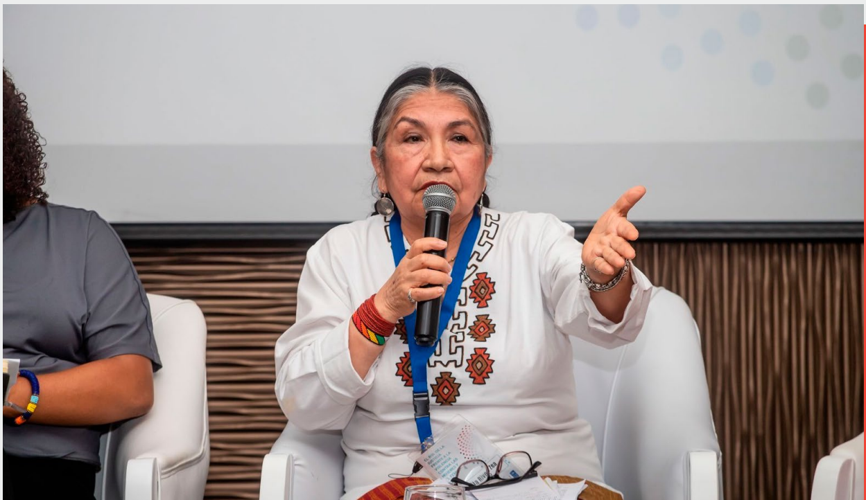
El rol de la justicia frente a la violencia contra las mujeres y el femicidio: Un análisis multidimensional en la región de América Latina, Ciudad de Panamá, Panamá, 2022