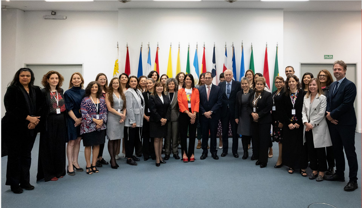
IV Reunión Plenaria de la Red Especializada en Género (REG) de la Asociación Iberoamericana de Ministerios Públicos (AIAMP), Ciudad Autónoma de Buenos Aires, Argentina, 2022