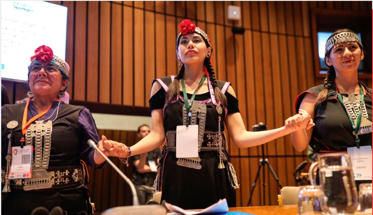
XIV Conferencia Regional sobre la Mujer de América Latina y el Caribe, Santiago, Chile, 2020