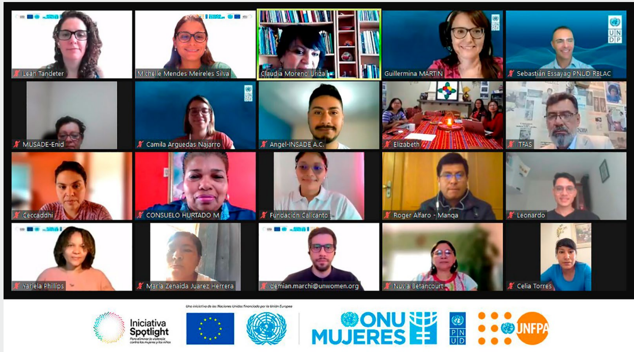
Reunión con las OSC que formaron parte del proyecto de Pequeñas Subvenciones, 2023