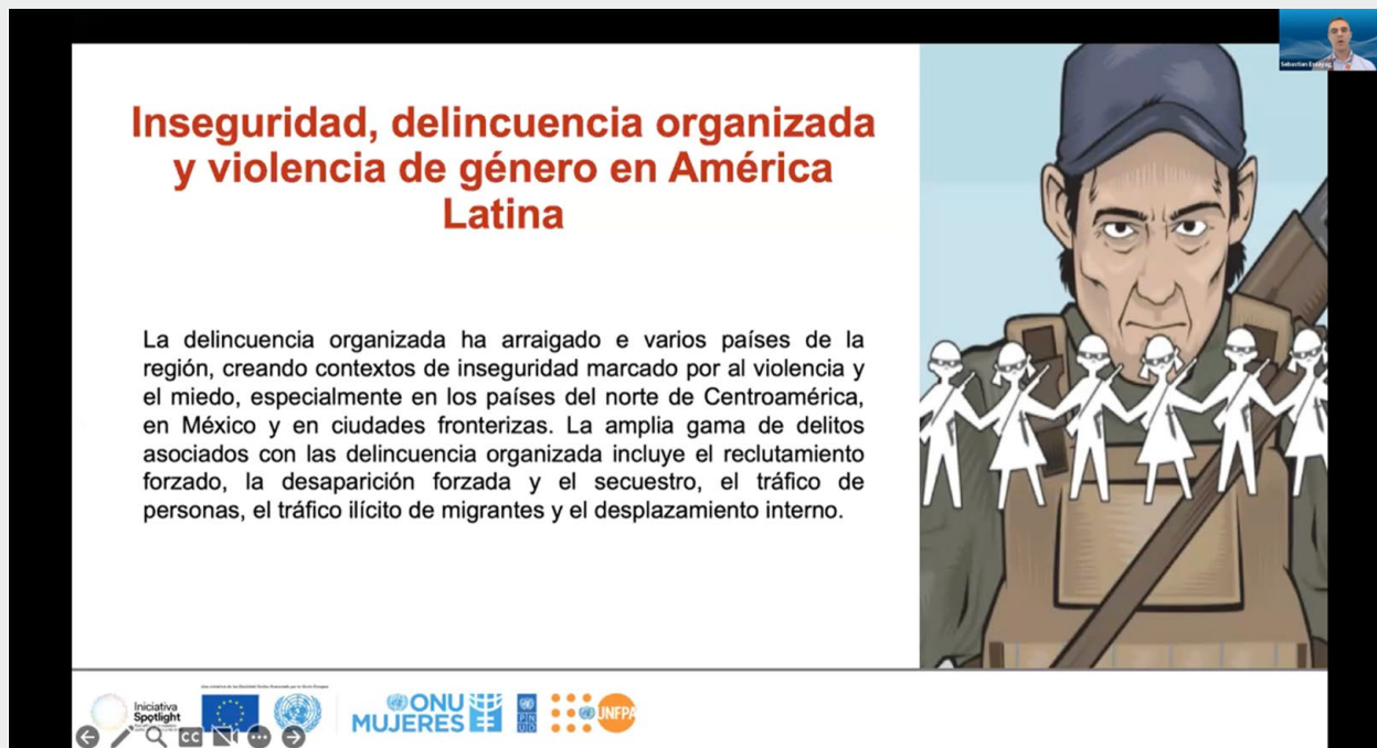
Enfoques multidimensionales para el abordaje de la violencia contra las mujeres y las niñas, incluido el femicidio/feminicidio, ciclo de webinars de cierre, 2023