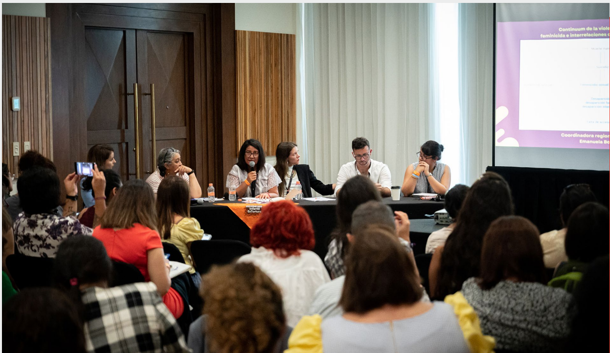
El equipo del Programa Regional participa de una intervención durante el SVRI, Cancún, México, 2022