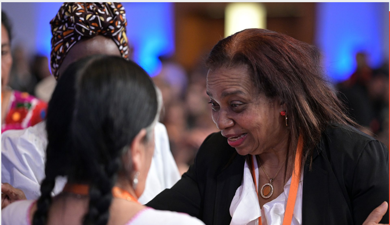
El GRSC participa de la Conferencia Regional de la Mujer, Buenos Aires, Argentina noviembre de 2022