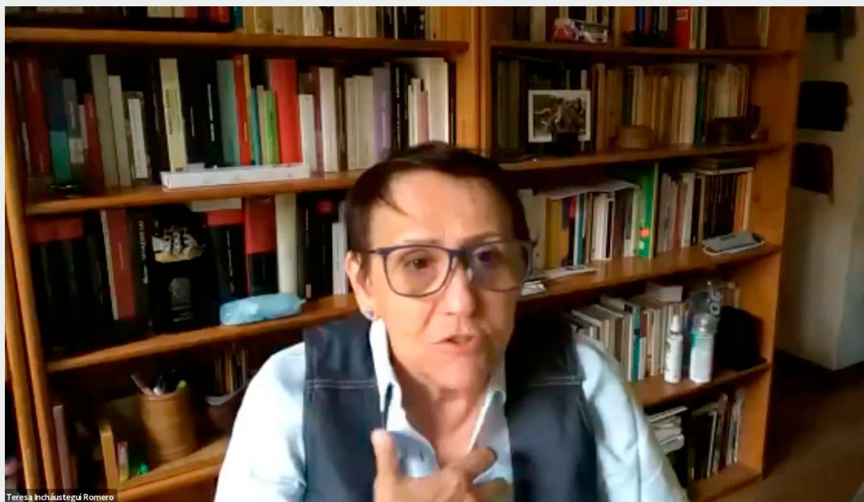
Institucionalización de los Resultados para la Eliminación de la Violencia Contra Mujeres y Niñas, Ciclo de Webinarios de Cierre, 2023