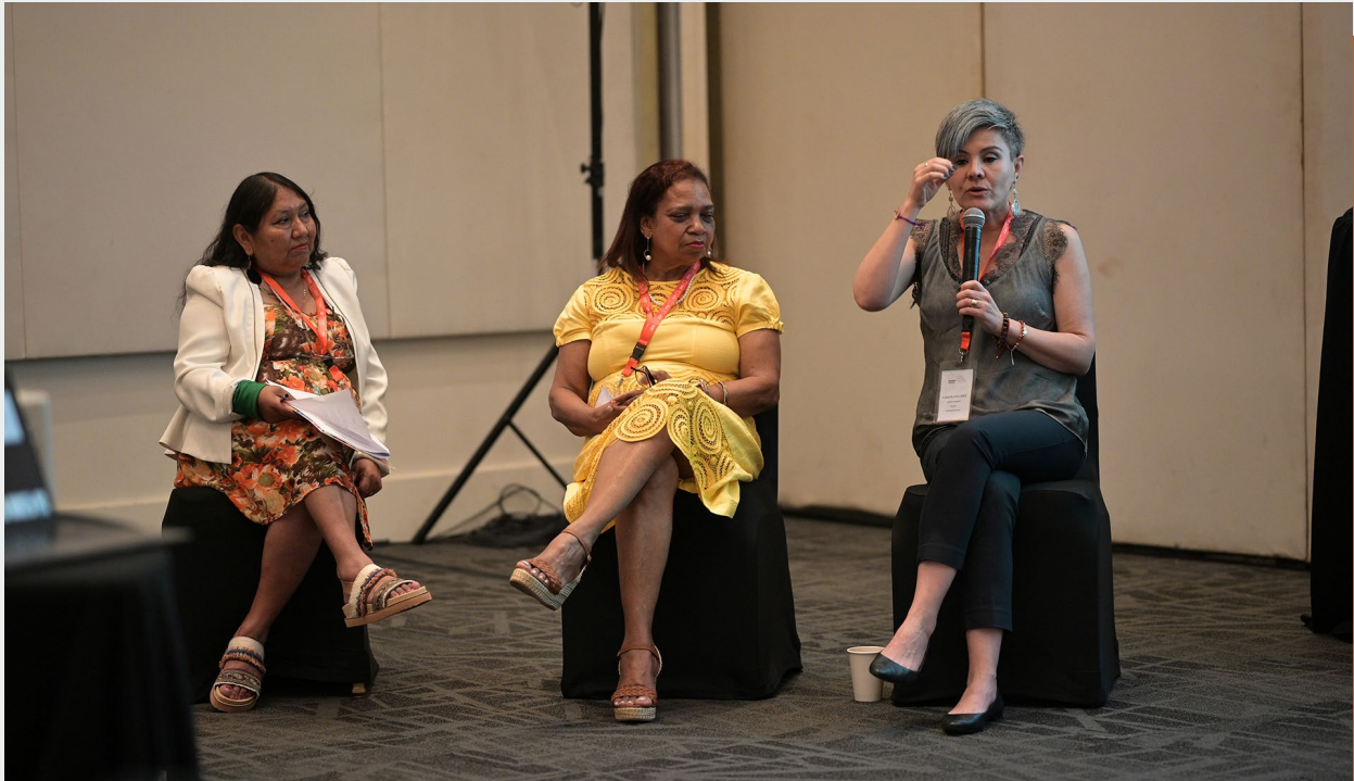
Incidencia y participación de la sociedad civil en el modelo de gestión, diseño, implementación y seguimiento de la Iniciativa Spotlight en América Latina y Centroamérica para la prevención y eliminación de las violencias de género y el feminicidio, Simposio Global de la Iniciativa Spotlight, Cancún, México, 2022