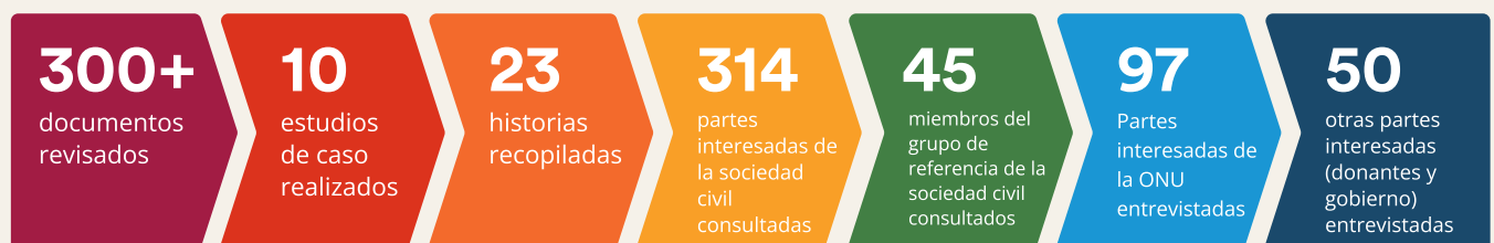
Figura 2. Instantánea de la recogida de datos

La evaluación adoptó un enfoque de estudio de casos, que incluía talleres participativos, debates en grupos de discusión y entrevistas en profundidad, complementados con una revisión de documentos a nivel mundial, regional y nacional, entrevistas a informantes clave (EIC) y recogida de historias para recopilar datos en relación con las preguntas de la evaluación. La siguiente figura ilustra el enfoque.