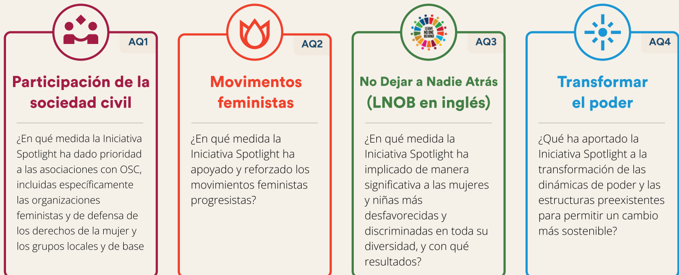
Figura 1. Preguntas de evaluación temática

La evaluación se propuso poner a prueba la siguiente hipótesis dentro de un enfoque de toda la sociedad, la mejor manera de contribuir a los esfuerzos para poner fin a la violencia de género contra las mujeres y las niñas (por una gran Iniciativa de la ONU) es apoyar y fomentar la construcción de movimientos feministas, privilegiar las asociaciones con organizaciones de la sociedad civil, incluyendo específicamente las organizaciones de derechos de las mujeres y las organizaciones locales de base, y aplicar de manera significativa el principio de no dejar a nadie atrás. El sistema/enfoque único de la ONU es un mecanismo adecuado y eficaz para lograrlo.